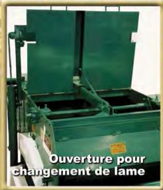
Ouverture pour changement de lame